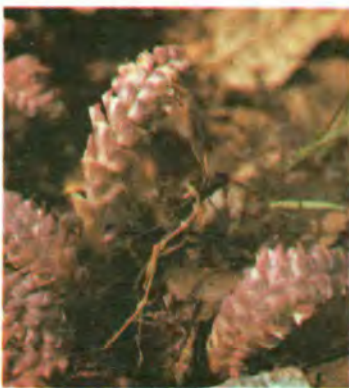
612. Петрів хрест лускатий.